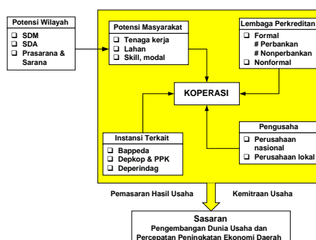
Gambar 2. Strategi Pengembangan UKM di Daerah

masyarakat; 2) pengusaha; 3) lembaga perkreditan; 4) instansi terkait; dan 5) koperasi sebagai badan usaha. Rangkaian kerja dari faktor pendukung UKM tersebut disajikan pada Gambar 2